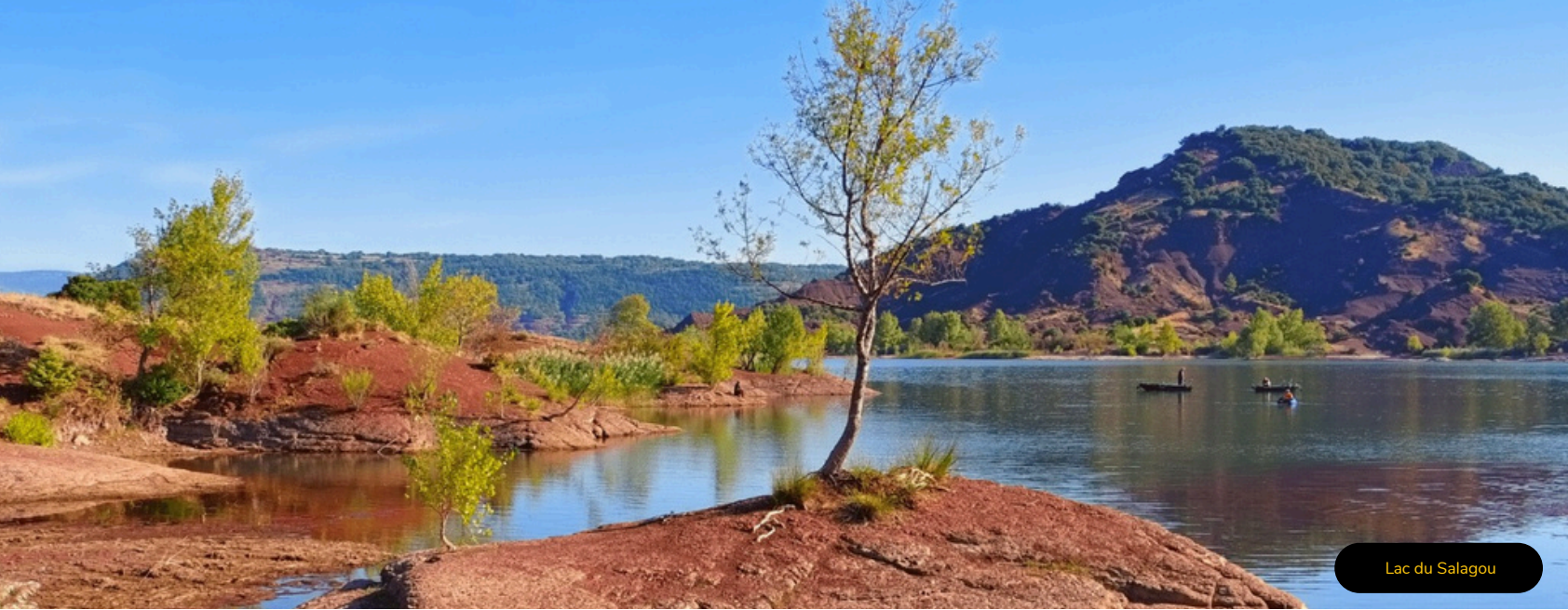
Lac du Salagou